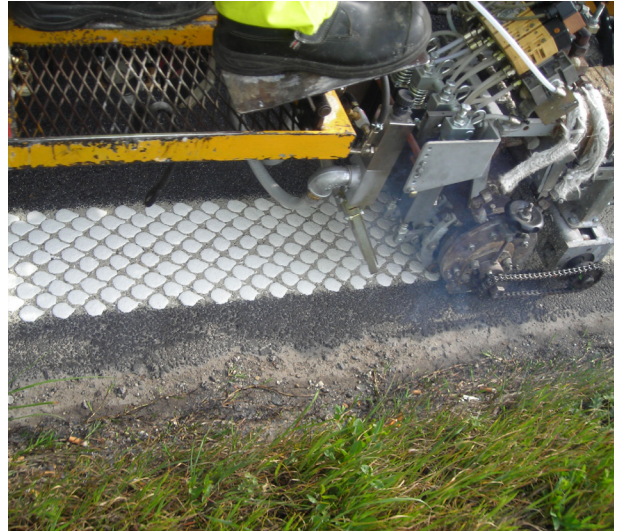
L'application de l'enduit à chaud ViaTherm™ combinée avec un saupoudrage de billes de verre spéciales, permet d'obtenir d'excellentes performances grâce au système ViziSpot™ .