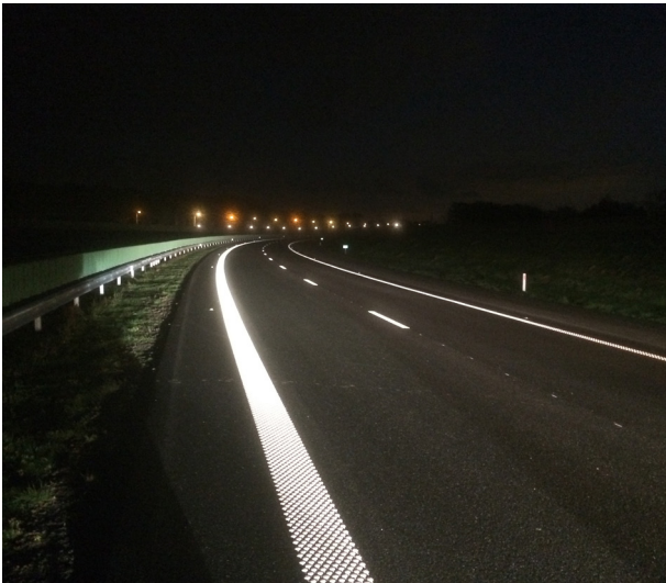
Nuit sombre et pluvieuse où la différence entre le système de marquage ViziSpot™ et un système de marquage structuré traditionnel est clairement visible. Les deux types de lignes différentes ont été appliqués au même moment.