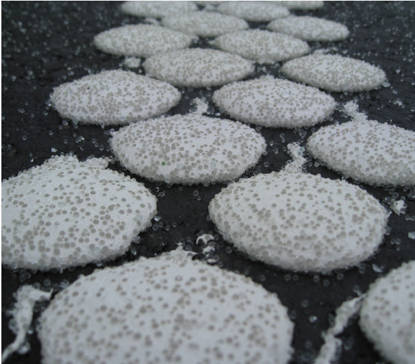
Plots arrondis du système ViziSpot™ . Plots de diamètre 3-4 cm et d'épaisseur 3-4 mm. Recouvrement de + de 70% de la surface +/- 5Kg/m 2 .